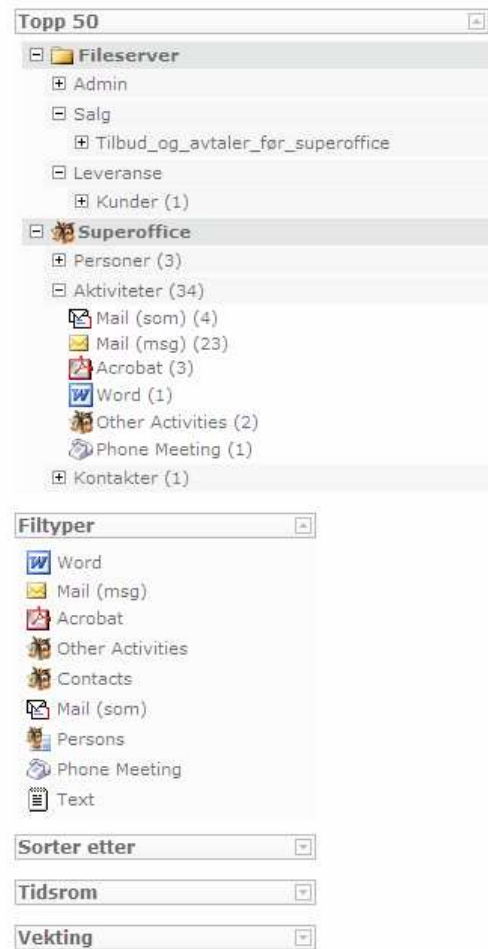
Figur 2: Navigatoren i InfoFinder gjør det svært lett å orientere seg i trefflisten. Her kan man på en intuitiv måte gjøre nye søk i utvalgte deler av kildene sine, med en enkelt museklikk.